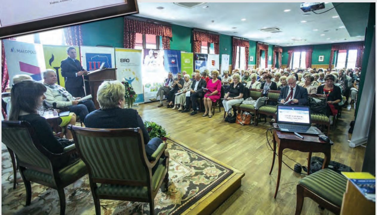
Sesja Plenarna Forum III Wieku, Miasteczko Galicyjskie, Nowy Sącz, 7.09.2018 r.