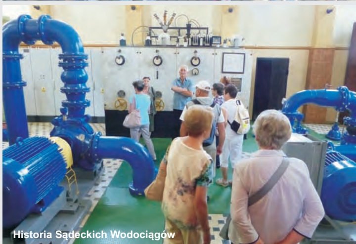
Historia Sądeckich Wodociągów