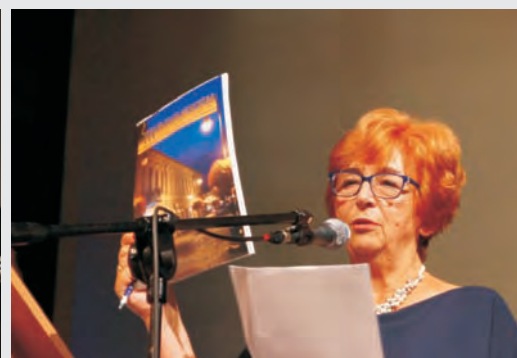
Prezentacja Biuletynu Sądeckiego UTW