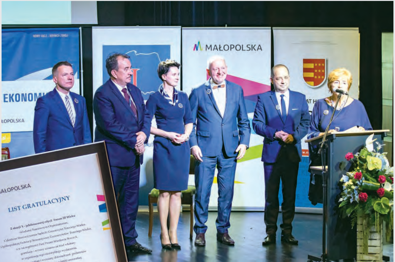
Inauguracja Forum III Wieku, Biblioteka PWSZ, Nowy Sącz, 5.09.2018 r.