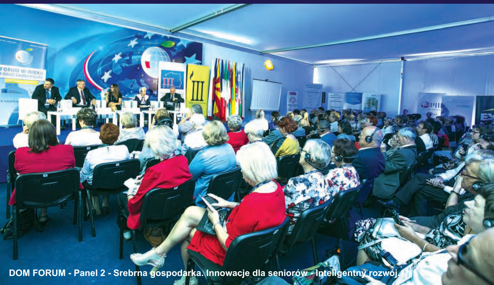
DOM FORUM - Panel 2 - Srebrna gospodarka. Innowacje dla seniorów - Inteligentny rozwój.