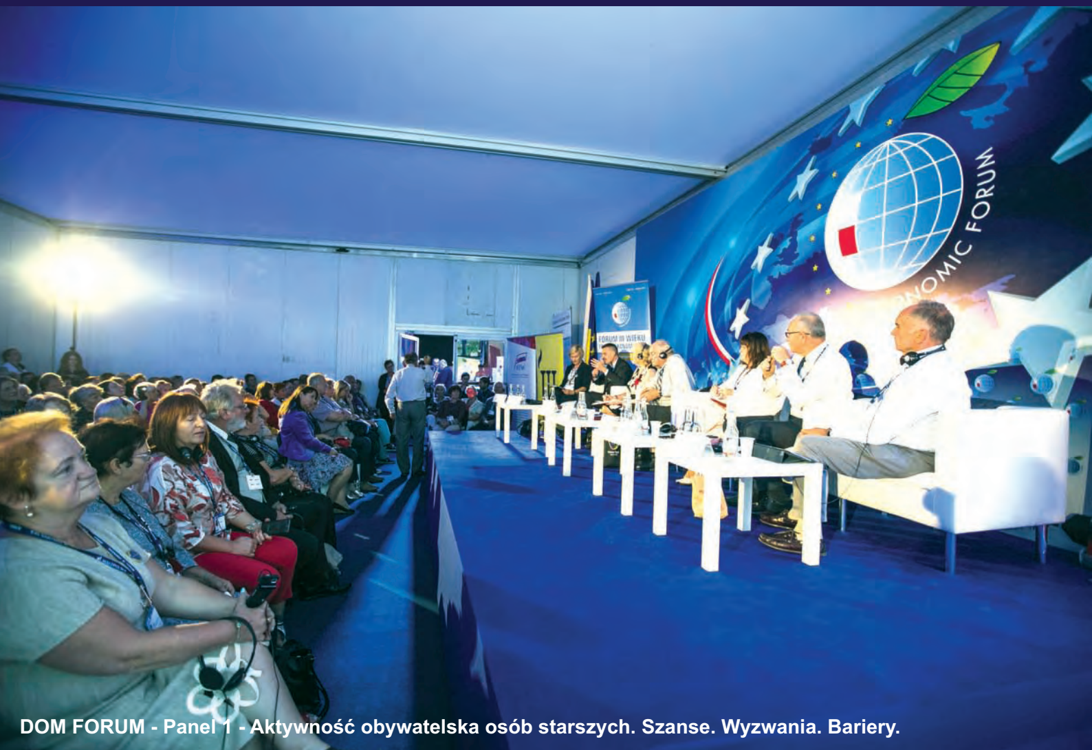
DOM FORUM - Panel 1 - Aktywność obywatelska osób starszych. Szanse. Wyzwania. Bariery.