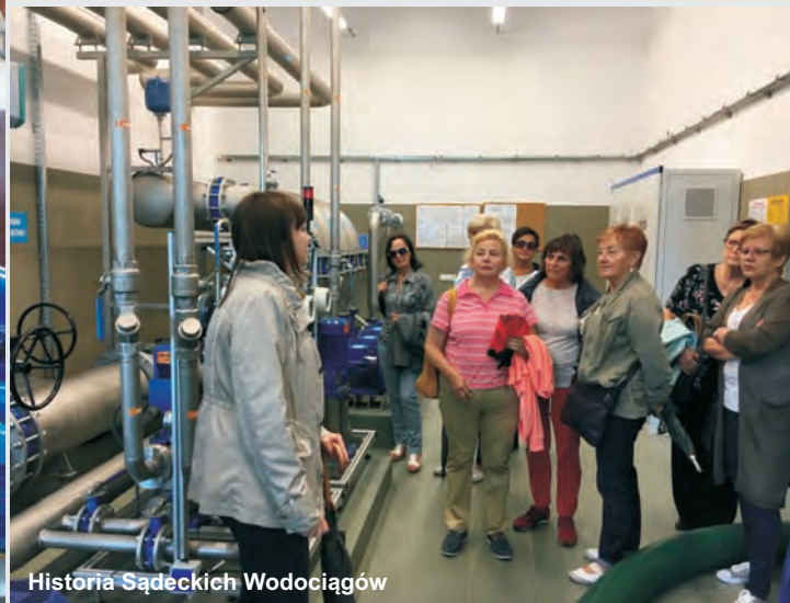
Historia Sądeckich Wodociągów