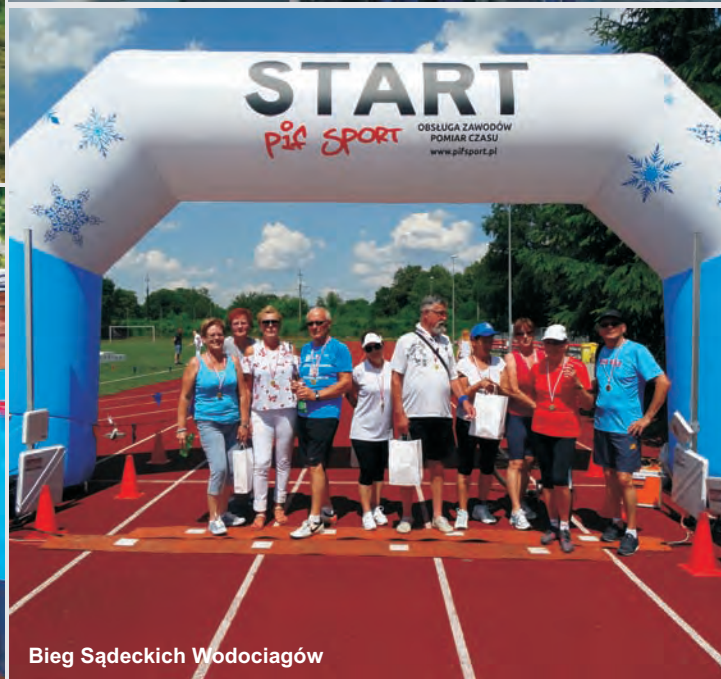
Bieg Sądeckich Wodociągów