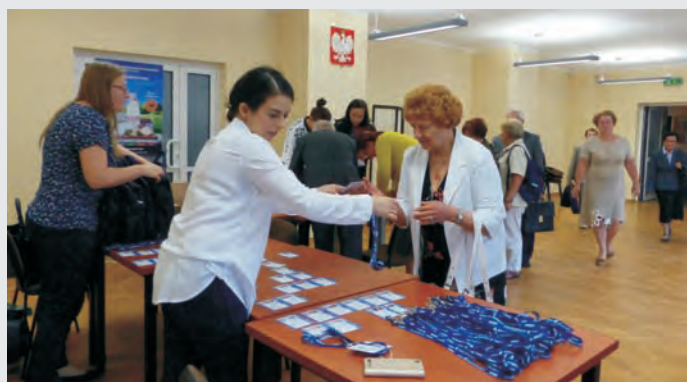
Rejestracja uczestników Forum III Wieku