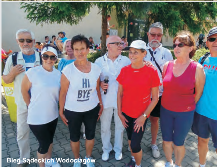
Bieg Sądeckich Wodociągów