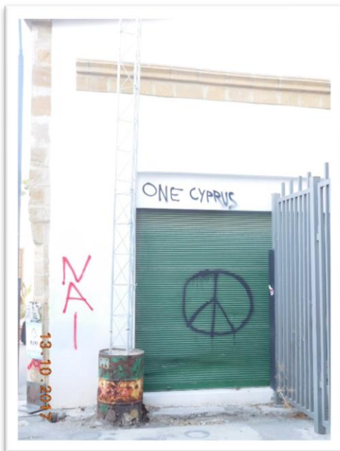
Bekennnis zur Einheit des landes